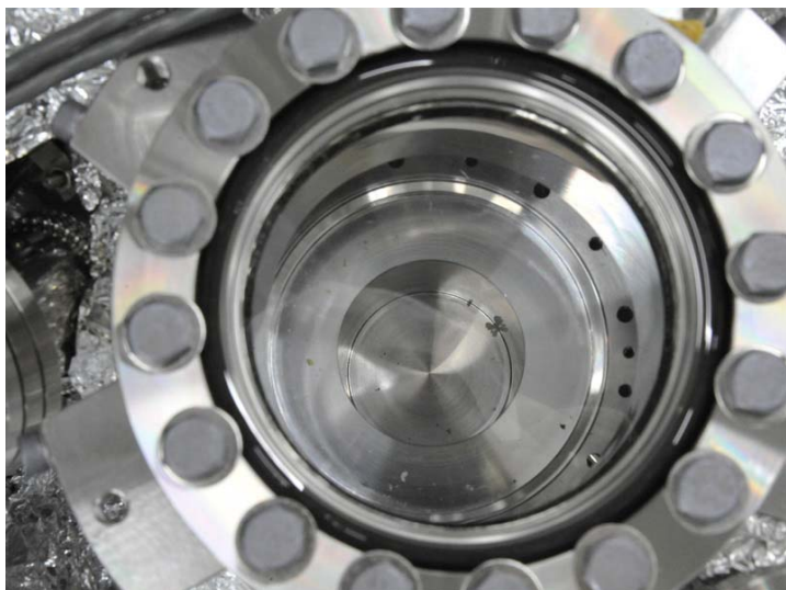
サンプルコンテナのフタを開封した所 (真空チャンバーの“フレンジ窓”越しに撮影)

なお、夏休み期間中に回収したカプセルの一部などを相模原市立博物館、JAXA 筑波宇宙センター、丸の内オアゾ 1階「〇〇広場(おおひろば)」で展示することになりました。(※)キュレーションセンター:試料の受入、処理、保管を行う施設