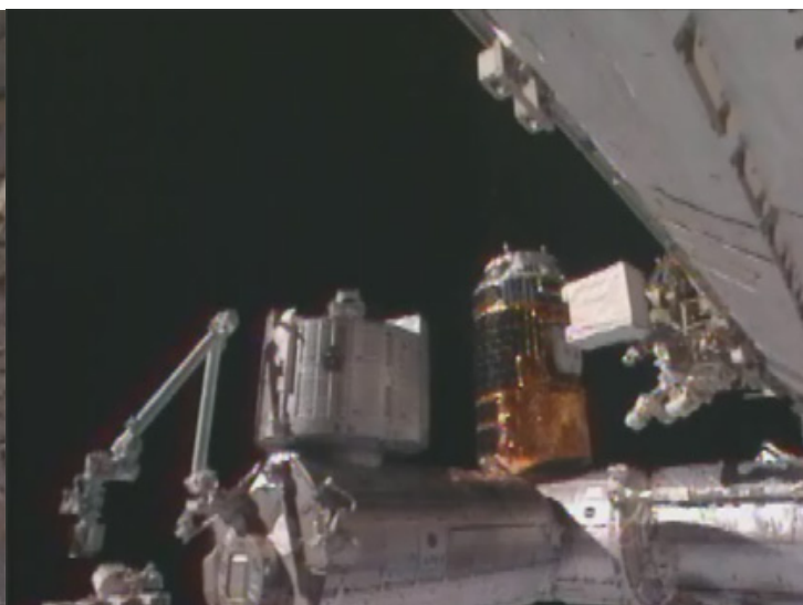
上:ハーモニー(第2結合部)天頂側に移設される「こうのとり」2号機(写真) / 下:地球側から天頂側への移設イメージ(CG)