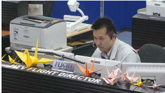
JAXA 筑波宇宙センター-HTV 運用管制室

下段：NASA や ESA(欧州宇宙機関)、ロシアの各宇宙センターの運用管制室でも、この度の東北地方太平洋沖地震で被災された方々へのお見舞いと復興への願いをこめた折鶴が作られています。