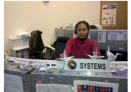
ESA 宇宙運用センター運用管制室

3月29日0:46(日本時間)に国際宇宙ステーション(ISS)から離脱した宇宙ステーション補給機「こうのとり」2号機は、3月30日12:09頃に、ニュージーランド東の海上上空において高度120kmに達し、大気圏に再突入しました。