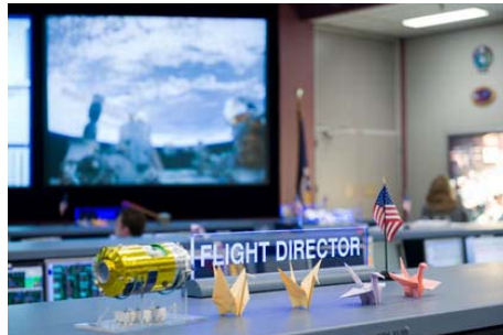
NASA ジョンソン宇宙センター運用管制室