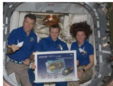
左：第26/27次長期滞在クルーと折鶴

「こうのとり」2号機には国際宇宙ステーション(ISS)に滞在中の宇宙飛行士(第26/27次長期滞在クルー)が、東北地方太平洋沖地震で被災された方々へのお見舞いと復興への願いをこめて折った折鶴が搭載されました。