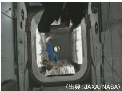
補給キャリアのハッチ方向から撮影