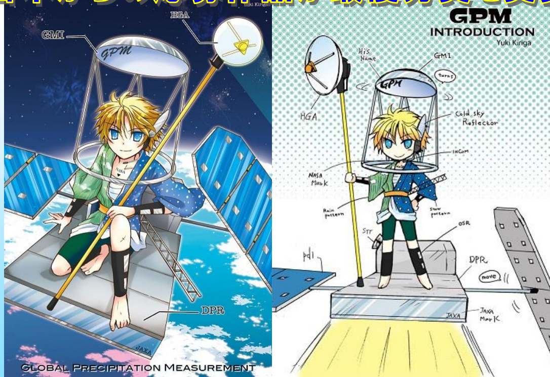
最優秀賞を受賞した作品「GPMくん」(左)と デザイン上の特徴を説明したイラスト(右) ©NASA

今後「GPM」くんはNASA公式の教育プログラムの漫画など広報ツールとして活用される予定